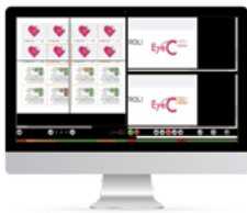
EyeC Profiler Content