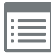
Audit Trail Viewer