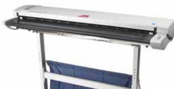
EyeC Profiler 900 - 1100 CS