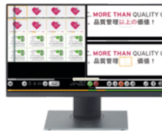
EyeC Profiler Graphic

Más información sobre nuestros productos: