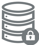
Base de datos segura