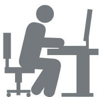
Sistema de inspección

nuestros sistemas de inspección en procesos existentes. Al utilizar nuestros sistemas, evita la retirada de productos, realiza controles de calidad rápidos y automatizados, aumenta la seguridad de sus datos y procesos, y se prepara bien para las auditorías.