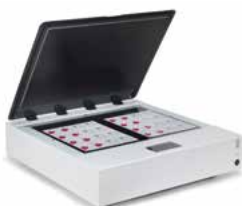
EyeC Profiler 400 - 600 DT