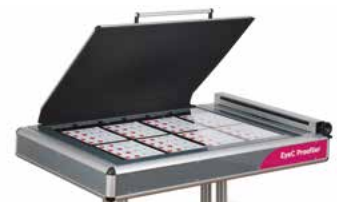
EyeC Profiler 900 - 1200 DT